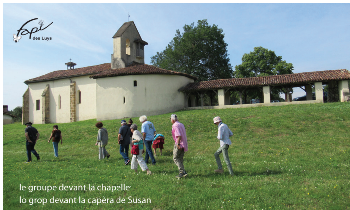
le groupe devant la chapelle lo grop devant la capèra de Susan

En juin la sortie annuelle de notre petit groupe nous a conduits à la découverte de la Haute-Lande à Suzan (où une guide enthousiaste nous a commenté en détail l'architecture et les fresques de la chapelle), Brocas les Forges (avec son étonnant site de hauts-fourneaux et son petit musée), Bélis.